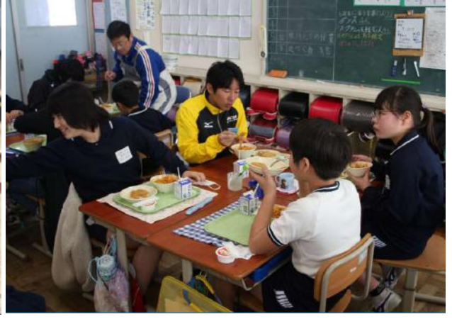
⑥ 那珂湊第二小学校