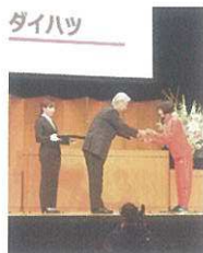
3位入賞！来年のシード権を獲得