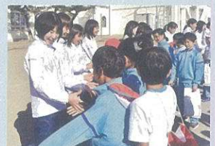
選手と別れを惜しみ、ハイタッチを求める児童たち