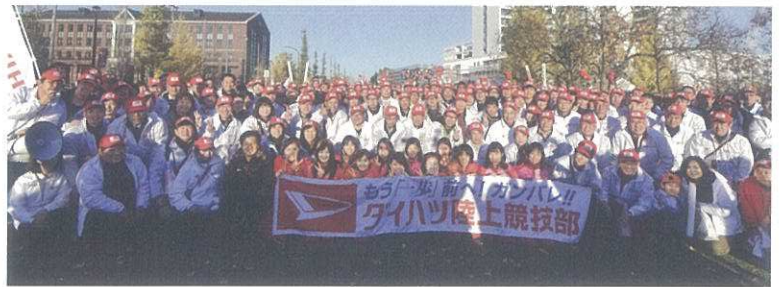
喜びの応援団と一緒にこの日一番の笑顔で記念撮影！

ゴールの仙台市陸上競技場の芝生広場では、(株)魚国総本社の方々が応援とともに温かい炊き出しを応援団に振るまってくれた。レースでは、選手たちが持てる力を各区分で出し切った結果、見事3位でゴールし、昨年に続き、来年のシード権を獲得。参加者たちは、好成績に喜びを爆発させていた。