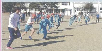
選手と一緒に、腿上げで動きづくり

冬の暖かい日差しの中、児童たちは元気よく体を動かし、選手たちは駅伝の疲れを見せる事なく、児童たちに走ることの楽しさを伝えた。